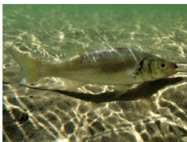
Bar juvénile ( Dicentrarchus labrax )

Situé aux portes de la Presqu'île de Crozon, le site de l'Aber est un lieu singulier, unique et emblématique de la baie de Douarnenez. Son histoire et sa géologie particulières sont tout aussi riches que la biodiversité qu'il abrite.