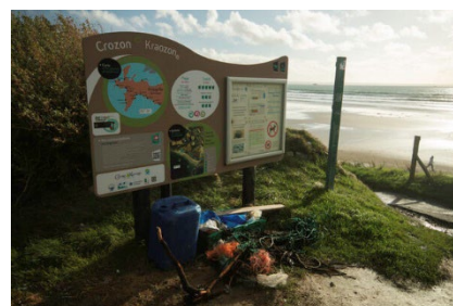
Dépôt de déchets plage de l'Aber

Et tout le monde s'y met car le site est aussi un lieu privilégié pour l'organisation de collectes citoyennes et spontanées. Un bac à marée y a donc été installé fin 2019. L'entreprise qui collecte les déchets de ces bacs (et qui en réalise le suivi pour le parc) récolte d'ailleurs à chaque passage des tas éparses de déchets réalisés par des collecteurs citoyens.